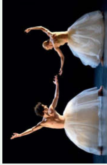
Floating Flowers

L'ensemble du Canadien Éric Gauthier, résident du Théâtre de Stuttgart, s'est donné pour mission de sensibiliser le plus de personnes possible à la danse, et même d'en attirer certaines qui n'auraient jusqu'à présent jamais envisagé de se rendre au théâtre. Si la transmission est une question de principe pour Gauthier, ce directeur dynamique accorde aussi beaucoup d'importance aux aspects sociaux de sa démarche. Mais ses initiatives et projets se basent avant tout sur une qualité artistique irréprochable, qui se manifeste tant par la virtuosité et la perfection technique de sa troupe que par les nombreux chorégraphes de renom auxquels il s'associe à Stuttgart. Le programme Stream a été développé spécifiquement pour Steps, Festival de danse du Pour-cent culturel Migros. Typique de la compagnie, il englobe six œuvres individuelles signées par Mauro Bigonzetti, Andonis Foniadakis, Itzik Galili, Po-Cheng Tsai, Nadav Zelner et Eric Gauthier en personne. Enlevé, poétique, grotesque avec toujours un trait d'humour, Stream montre toute la palette des possibilités qu'offre l'art de la danse. Un délicieux feu d'artifice d'impressions que Gauthier Dance porte à la scène et qui invite à rire, à réfléchir et à s'émerveiller.