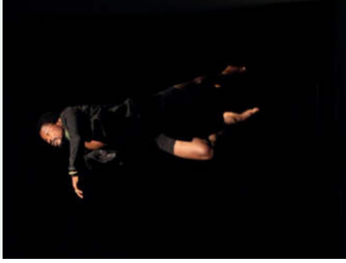
Florent Nikiema

Dit simplement: Deux chorégraphes hommes et une chorégraphe femme ont gagné les premières places d'un concours pour leurs solos de danse. Le concours avait lieu en Afrique de l'Ouest. Les chorégraphes présentent trois de leurs spectacles à Steps.