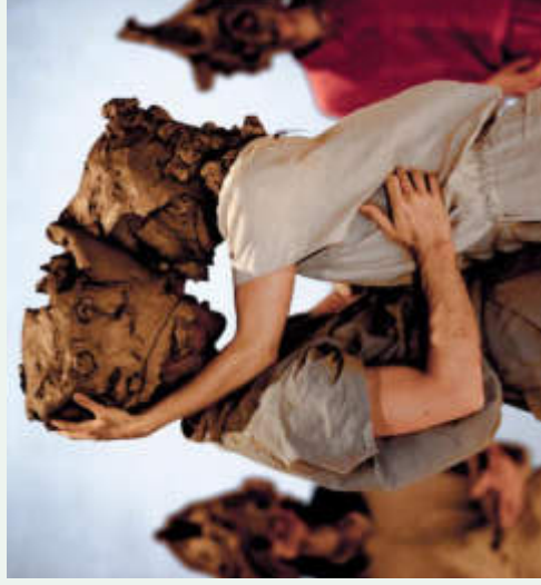
Icon

Le milieu de la danse contemporaine ne présente guère d'artistes s'aventurant avec autant d'audace et d'aisance dans les directions les plus diverses que le chorégraphe belgo-marocain Sidi Larbi Cherkaoui. Celui-ci ne cesse de découvrir un public fidèle et enthousiaste. Le moteur de cet irrépressible besoin de découverte est son immense intérêt pour l'être humain sous toutes ses facettes. Et si la nature humaine le pousse parfois au désespoir, les séquences chorégraphiques que Cherkaoui développe au cours de ses recherches éfrénées sont tout simplement sublimes. Il n'en va pas autrement des deux créations Noetic et Icon , que Cherkaoui a créées en collaboration avec le sculpteur Antony Gormley et dont l'opposition complémentaire permet de présenter les deux côtés d'une médaille: lucide, légère, claire, Noetic est dédiée aux structures de la pensée et de l'interaction, tentant de donner une forme à l'insaisissable. Icon , en revanche, accentue le poids de notre être physique et sensuel, avec notamment 3,5 tonnes de glaise sur scène. Cette dualité est encore soulignée par le contraste entre la qualité de mouvements de la GöteborgsOperans Danskompáni, la plus grande compagnie de danse contemporaine de Scandinavie, et celle d'Eastman, la troupe de Cherkaoui. Avec cette production, c'est une œuvre époustouflante qui attend le public de Steps, Festival de danse du Pour-cent culturel Migros.