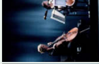
mutual comfort