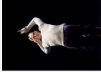
I New Then