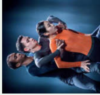
mutual comfort

Depuis sa création en 1959, le Nederlands Dans Theater (NDT) est un véritable phénomène. La troupe, synonyme d'excellence de par la qualité de ses danseurs, est aussi une source intarissable de nouveaux grands noms de la chorégraphie. La compagnie junior, le NDT 2, créée en 1978 en complément à la formation principale, a fortement contribué à la réputation et au succès de la troupe néerlandaise. Ce pari audacieux à l'époque a fait école, puisqu'il existe aujourd'hui de nombreuses compagnies de ce type. Mais le NDT 2, véritable référence en la matière, continue d'attirer de jeunes danseuses et danseurs de 17 à 24 ans venus du monde entier. Ceux-ci y ont la chance unique de se frotter, dès le début de leur carrière, à l'élite chorégraphique mondiale. Ces conditions créatives exceptionnelles les font évoluer en tant que danseurs, mais leur donnent aussi un précieux bagage pour une future carrière de chorégraphe. Pour l'édition 2018 de Steps, le NDT, qui a marqué l'histoire du Festival de danse du Pour-cent culturel Migros depuis ses débuts, présente sa compagnie junior dans un programme réunissant tous les ingrédients qui fascinent dans cette troupe hors du commun: des chorégraphies hors pair signées Hans van Manen, Johan Inger, Edward Clug ou encore León & Lightfoot, une technique époustouflante, un rythme effréné et une élégance raffinée souvent rehaussés d'une pointe d'humour.