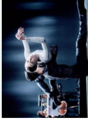
mutual comfort