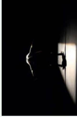
Fatoumata Bagayogo © Margo Tamize