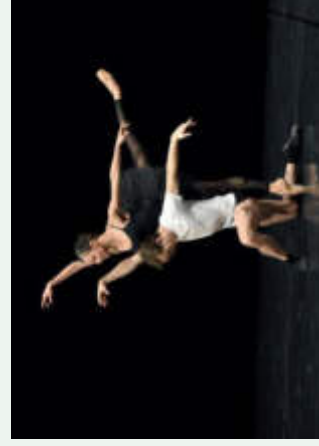
Ballet 102

Dit simplement: Le programme se compose de six pièces différentes. Chaque pièce a été créée par quelqu'un de différent. Les danseurs et les danseuses viennent de Stuttgart en Allemagne. Dans leur programme Stream , ils montrent tout leur talent.